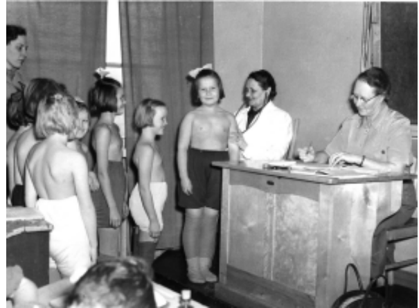
Alma koululaisia tarkastamassa

Ruokaa meillä korttiajasta huolimatta oli, sillä monet potilaat ja sukulaiset muistivat meitä ruokapaketein. Kyllä sinä varmaan huomasit, että kellarin hillopurkeissa ilmeni hävikkiä tai talviomenat korissa vähenivät, mutta koskaan et siitä huomauttanut tai moittinut.